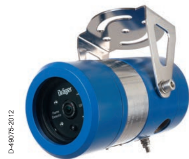
Dräger Flame 3000 Ваш оптический извещатель пламени

Симулятор пламени Dräger FS-5000 может гарантированно активировать извещатель Dräger Flame 3000 на расстоянии до 8 м. Электроника размещена в корпусе с исполнением для эксплуатации в опасных зонах 1.