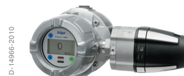
Dräger Polytron 8720 с присоединенной распределительной коробкой e-Box: версия с проводкой повышенной безопасности.

Одна конструкция, один принцип действия: Серия Polytron 8000