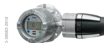
Dräger Polytron 8720 Взрывозащищенный датчик газов для контроля концентрации диоксида углерода.

Более 40 лет Dräger разрабатывает и производит сенсоры и датчики газов для промышленного использования. С каждым новым поколением приборов мы улучшаем технологию измерений. Используя Polytron 8720, вы получите преимущества накопленно-