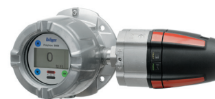
Dräger Polytron 8700 Взрывозащищенный датчик газов для контроля горючих газов.