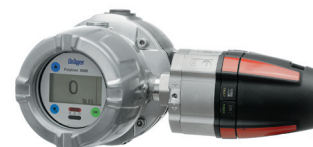
Dräger Polytron 8700 с присоединенной распределительной коробкой e-Box: версия с проводкой повышенной безопасности.

Одна конструкция, один принцип действия: Серия Polytron 8000